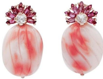
شکل 2: جواهر تلفیقی از مرجان سفید، یاقوت و الماس