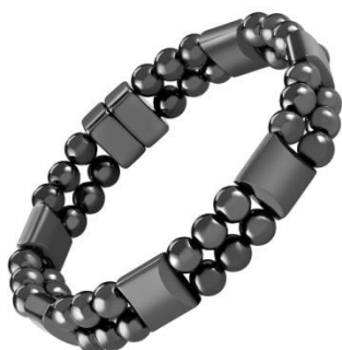
شکل 1: دستبند ساخته شده از حدید (هماتیت)

«حدید» از واژگان قرآنی و به معنای تیز و برنده و نیز به معنای آهن است و همچنین نام یکی از سوره های مبارک قرآن می باشد (خرمشاهی، 1377). کلمه «حدید» به معنی آهن، شش بار در قرآن کریم آمده است: سوره اسراء آیه 50، سوره کهف آیه 96، سوره حج آیه 21، سوره سباء آیه 10، سوره ق آیه 22 و سوره حدید آیه 25. در تمام آیه ها و سوره های قرآن به جز سوره ق، منظور از «حدید» همان فلز آهن است.